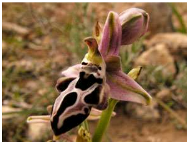
Ophrys species 01, mogelijk kleurvariëteit van Ophrys cretica Ophrys cretica subsp.beloniae subsp.beloniae