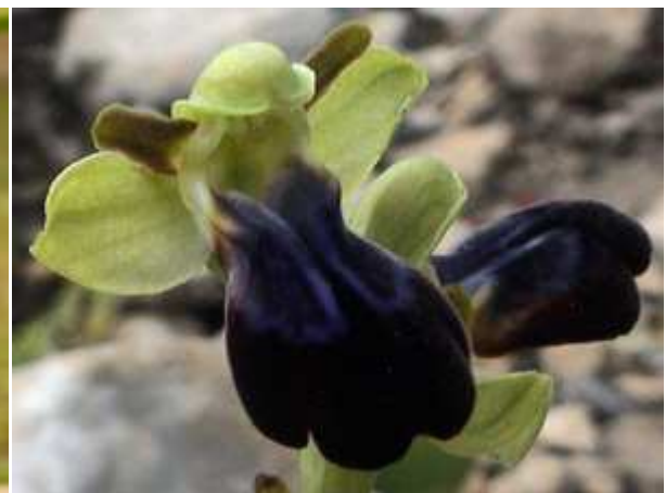
Ophrys iricolor subsp. villosa