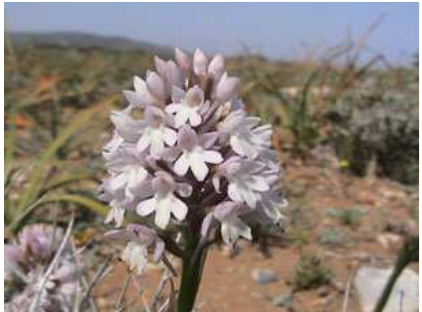
Anacamptis pyramidalis semi-alba

Onderweg stopten we nog enkele keren en vanzelfsprekend vonden we weer enkele orchideeën. Ophrys lutea , Serapias orientalis , Anacamptis pyramidalis , Orchis papilionacea subsp. heroica ook Anacamptis pyramidalis semi-alba