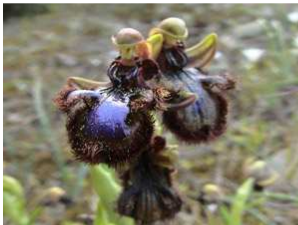
Ophrys vernixia subsp.orientalis