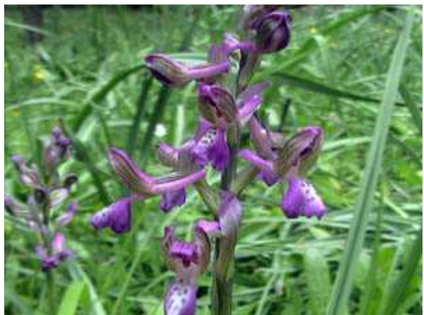
Orchis morio subsp. picta

Helemaal boven op de berg, stond een wel erg mooie, spijtig genoeg vervallen villa. Daar zou Mussolini verbleven hebben. Hij was van daaruit heerser over een twaalftal eilanden die destijds als provincie bij Italië waren ingelijfd. Vanzelfsprekend ook hier weer langs de kant van de weg Orchis provincialis , Neotinea maculata , Orchis laxiflora , en enkele Ophryssen .