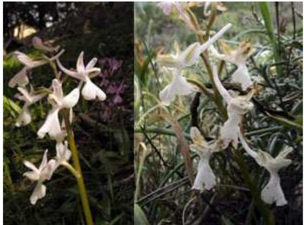
Orchis anatolica alba