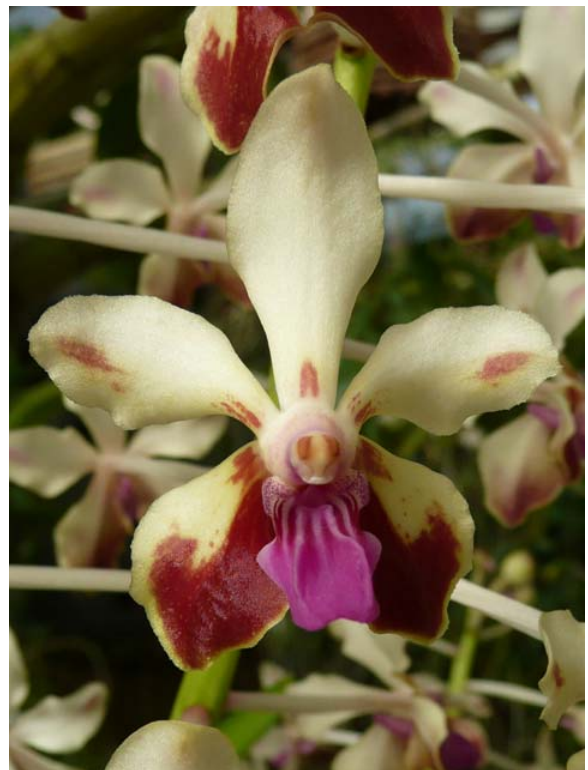
Vanda lamelata toxalii